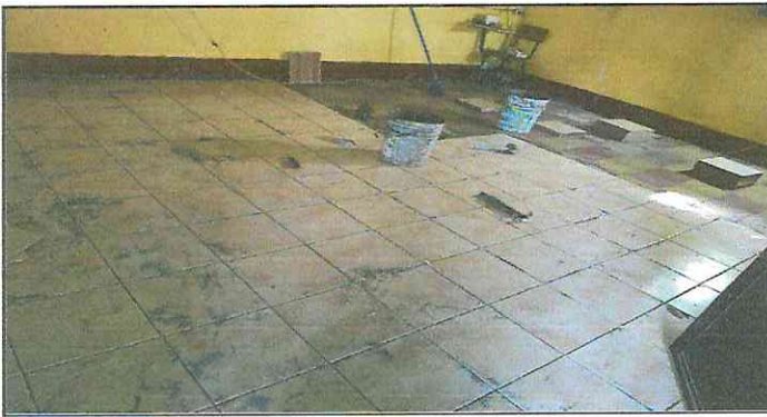
Foto 5: Sustituyendo el piso de torta de concreto a piso cerámico.