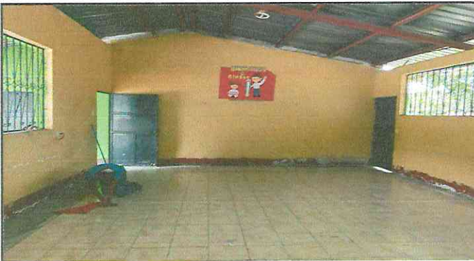
Foto 3: Sustituyendo el piso de torta de concreto a piso cerámico.