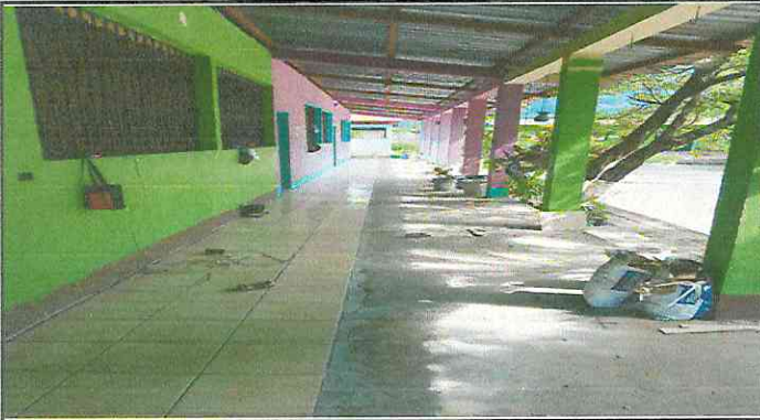
Foto 1: Sustituyendo el piso de torta de concreto a piso cerámico.