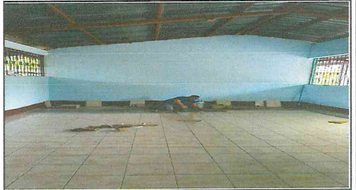
Foto 4: Sustituyendo el piso de torta de concreto a piso cerámico.